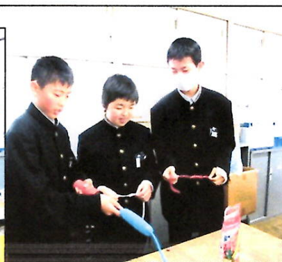
飾りつけの実行委員が、テーマ「感謝」に合わせて屋運内の飾りつけを制作しました。